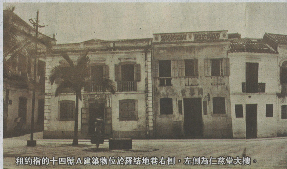
租約指的十四號A建築物位於羅結地巷右側，左側為仁慈堂大樓。